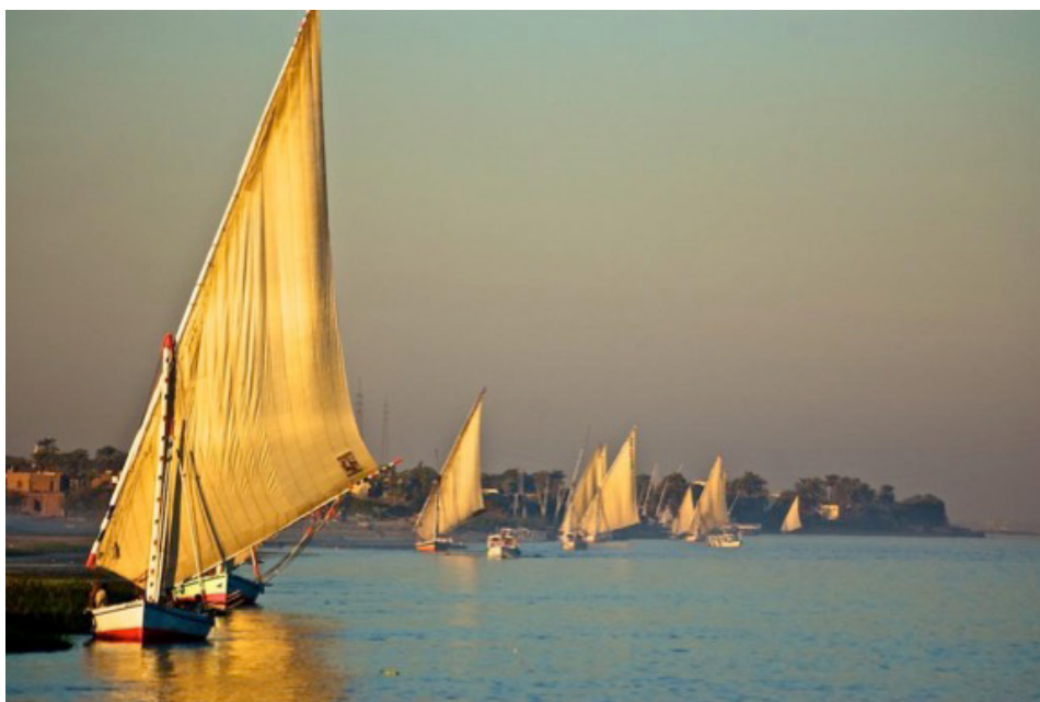
Vallée du Nil, Egypte.

L'Institut du monde arabe et Sisygambis présentent un web-documentaire multilingue (français, anglais et arabe) Les Ports, de la Méditerranée à l'océan Indien , un voyage immersif à travers les ports contemporains sous forme de carte interactive. Ce web-documentaire met en lumière les navigateurs et les marchands qui ont traversé ces points d'encrage emblématiques et chargés d'histoire par les échanges qu'ils ont permis, qu'ils soient culturels, religieux ou commerciaux. De Tanger (Maroc), Alexandrie (Egypte), Nairobi (Kenya) à Dar Es Salaam (Tanzanie) en passant par Mamoudzou (Mayotte), 32 villes portuaires de 7 pays d'Afrique sont à découvrir.