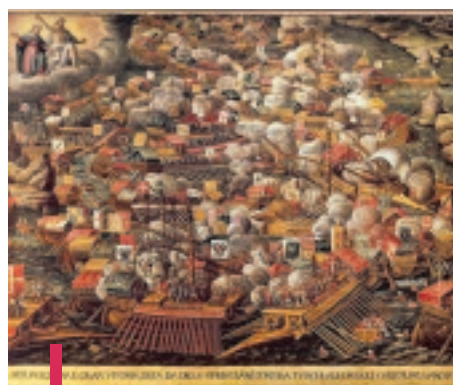
Bataille de Lépante. Vénétie, 1571-1600. Huile sur toile. Fondazione Musei Civici di Venezia Museo Correr, Venise, Italie.

4 De 1405 à 1433, l'amiral chinois Zheng He mène sept expéditions jusqu'au Moyen-Orient et en Afrique de l'Est. Depuis l'actuel Kenya, il rapporte une girafe à l'empereur. Les plus grands de ses navires étaient deux fois plus longs que ceux avec lesquels Christophe Colomb ira en Amérique, près d'un siècle plus tard.